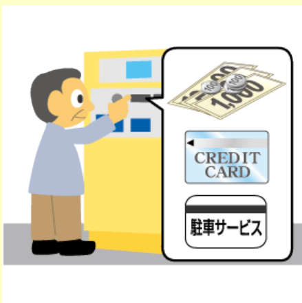
精算機で割引処理済の駐車券を挿入し精算