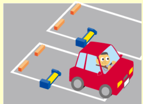
フラップ板が下がったことを確認して出庫