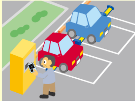
場内の精算機より駐車券を発行