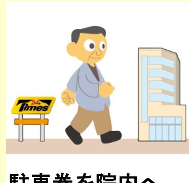
駐車券を院内へお持ちいただきます