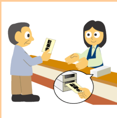
総務窓口にて駐車券を提示し無料処理を受ける