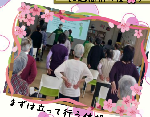
まずは立って行う体操です