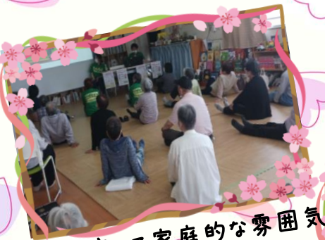
みんなで座って家庭的な雰囲気

今年の桜はあっという間でしたね。満開は2週間前でした。 今回のテーマは「腰痛体操」でした。皆さん腰痛にはお悩みのようで、 新規参加者7名を含む、28名の方に参加して頂きました。 寝転がっての体操等、家庭的な雰囲気の中、一生懸命取り組まれていました。